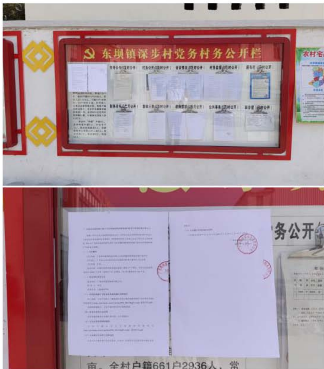
图 3-6 深埗村委张贴公开

本次征求意见稿在项目周边主要村庄进行张贴公开，符合《办法》中“建设项目所在地公众易于知悉的场所”的条件，有利于更多人知晓项目建设情况和发表对项目环境影响评价工作的意见或建议。张贴公开时间为2024年12月31日至2025年1月14日，共10个工作日。张贴公开情况见图3-6至图3.2-14。