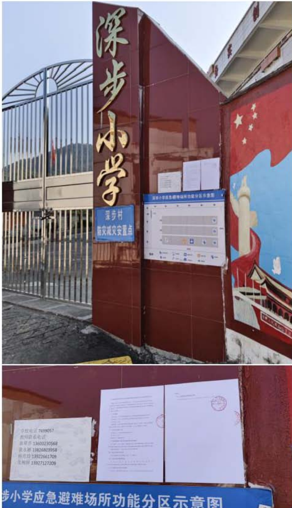
图 3-9 深步小学张贴公开