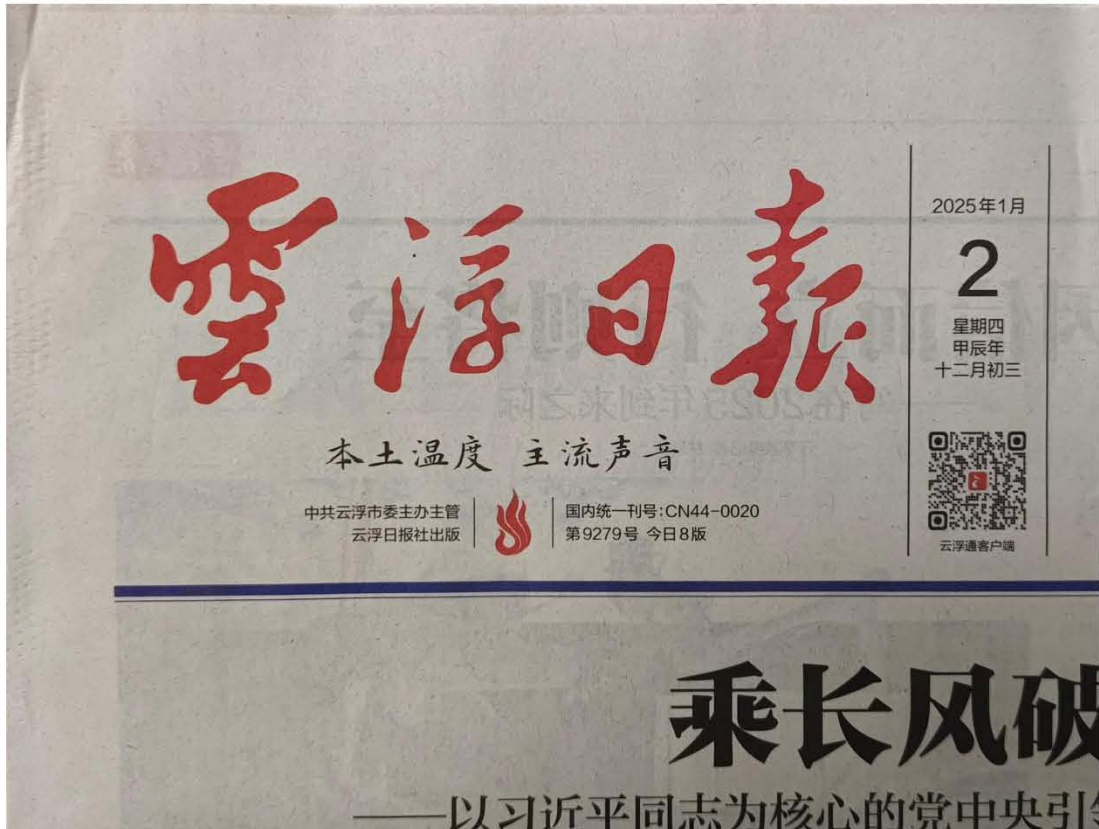
图 3-4 第二次登报于 2025 年 1 月 2 日