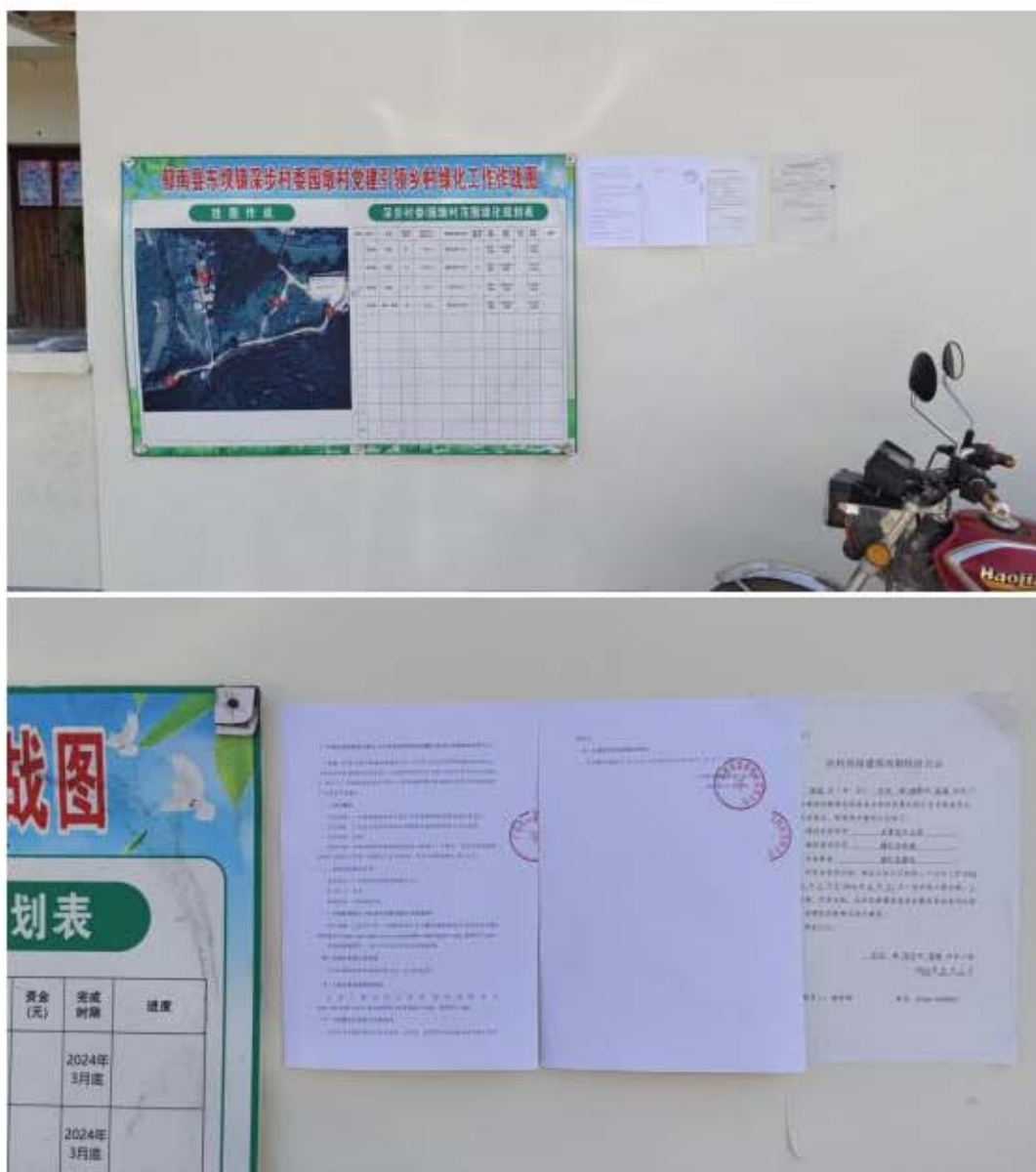
图 3-11 深步村委园墩村张贴公开