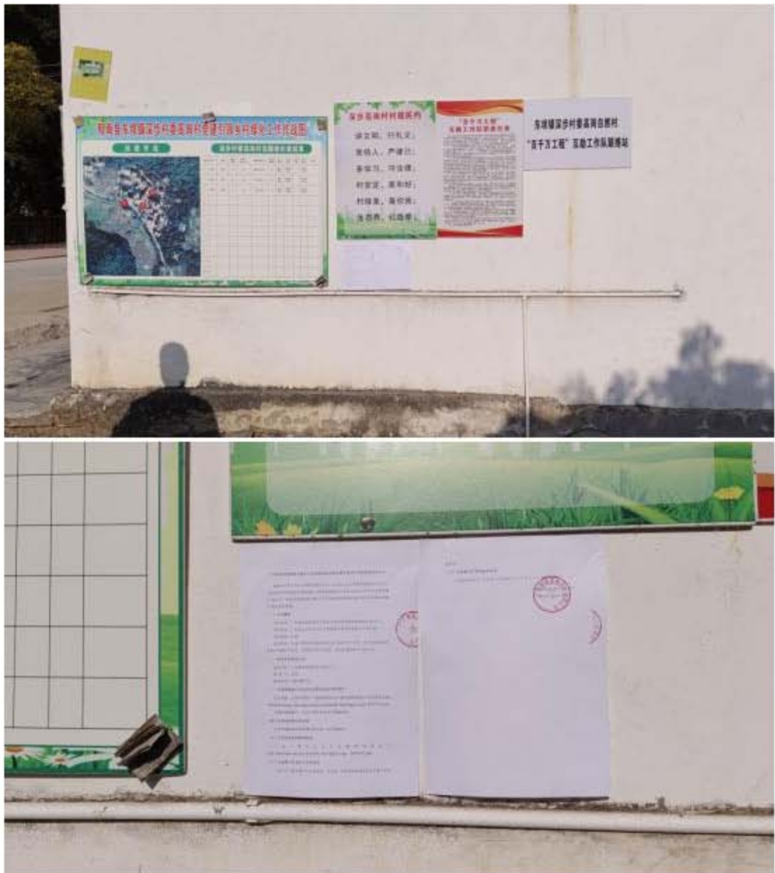
图 3-7 深埗村委高岗村张贴公开