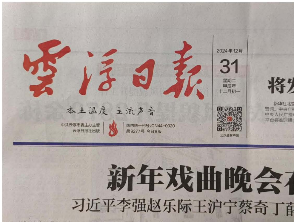
图 3-2 第一次登报于 2024 年 12 月 31 日

《办法》中“公示期限内公开信息不得少于2次”的规定，征求意见稿分别于2024年12月31日和2025年1月2日共两次登报公开。登报公开情况见图3-2至图3-5。