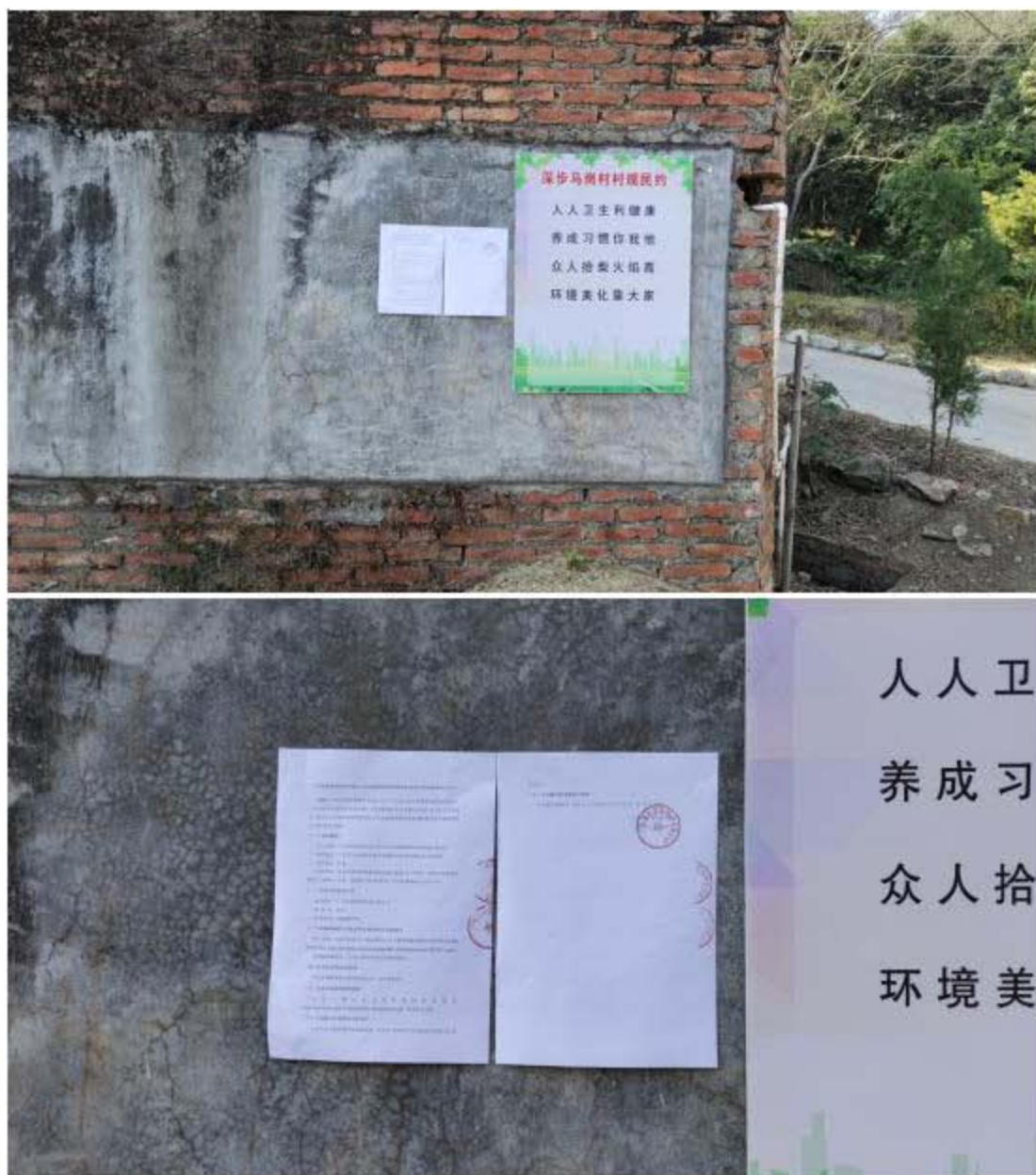
图 3-8 深步村委马岗村张贴公开