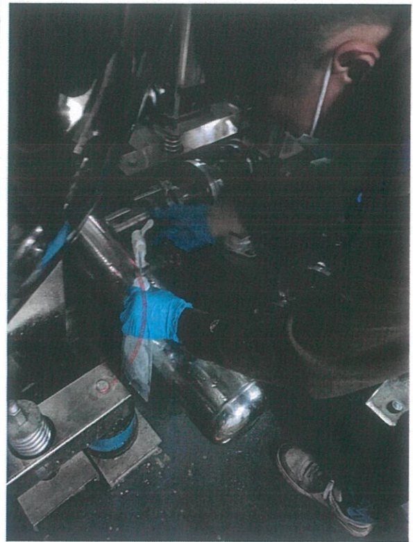
碧桂园林云苑饮用水监测点（二次供水）